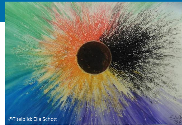
@Titelbild: Elia Schott